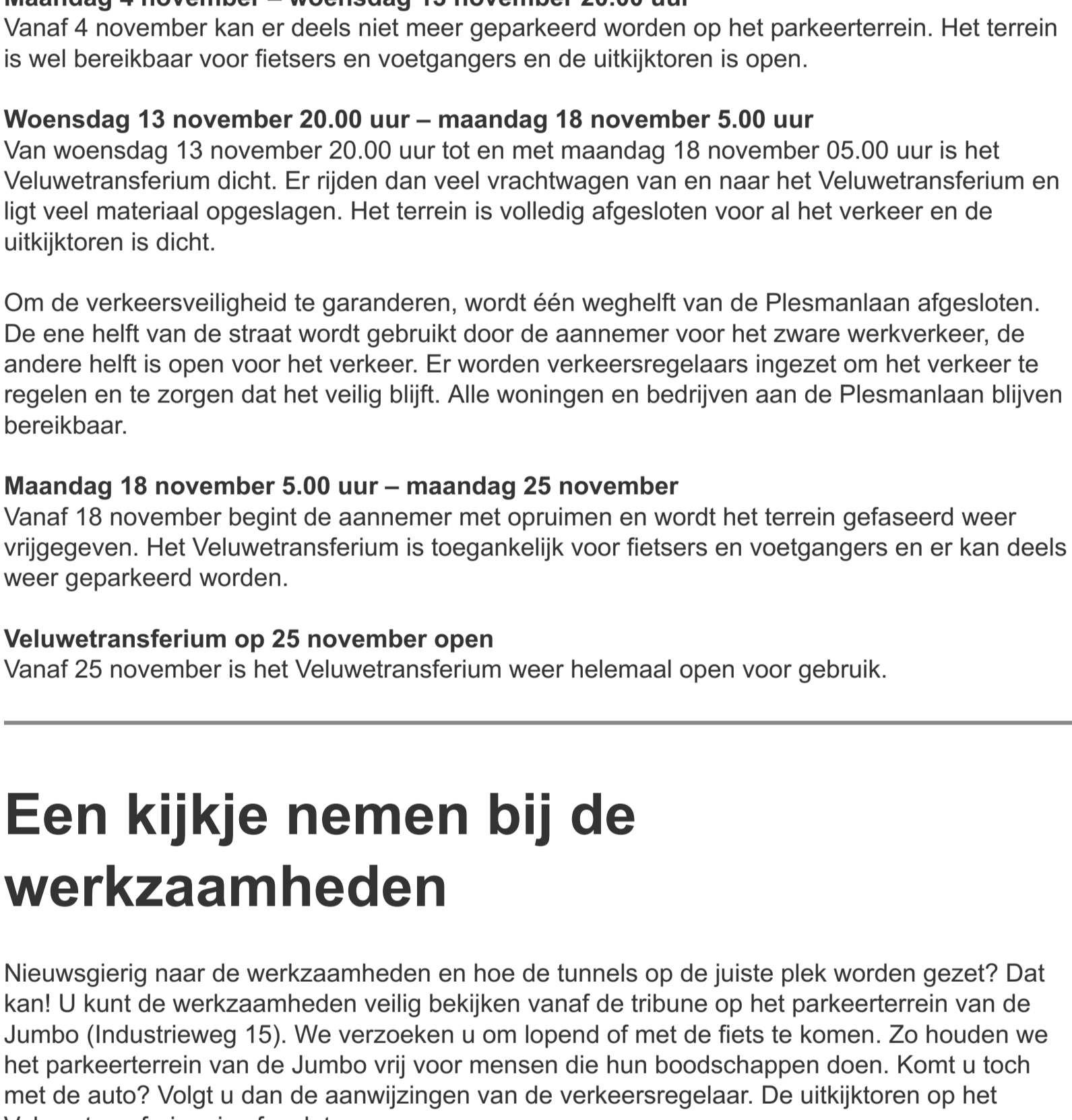
Afbeelding 3: Afsluiting Veluwetransferium en locaties (tijdelijke) bushaltes

Kijk voor de meest actuele reisinformatie op www.ns.nl .